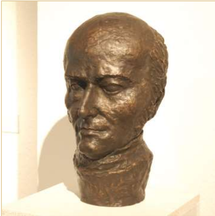
Minden öntvény egyedi darab.

Ékszerként jelenhet meg például az íróasztalán, a rendelőjében, egy kirakatban. Nagyszerű ajándék lehet vagy szolgálhat kitüntetés mellé adandó elegáns kísérőül.