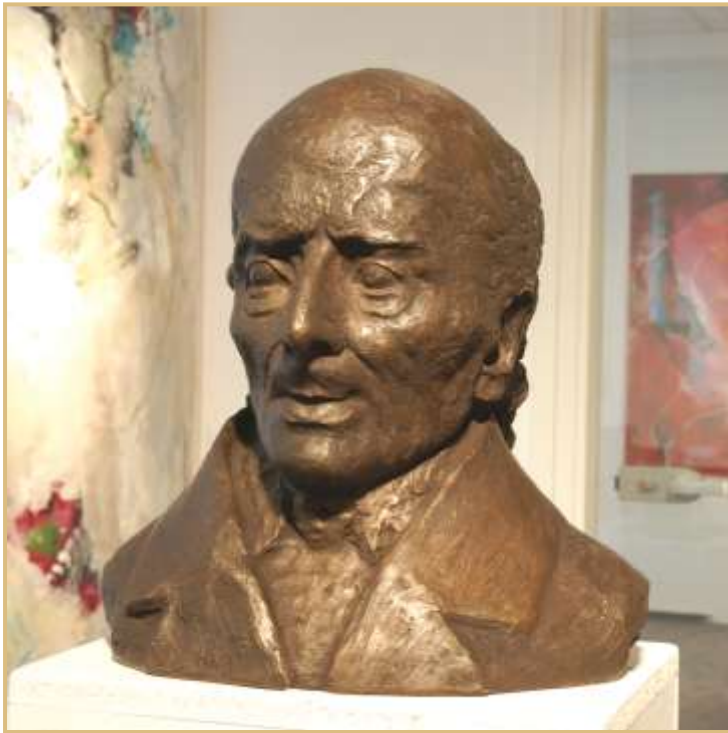
Minden öntvény egyedi darab.

A portrészobor kítűően alkalmas rendelők, iskolák, gyógyszertárak, aulák, kongresszusi termek, színpadok, kórházak, intézmények és homeopátiás készítményeket gyártó üzemek kül- és beltéri díszítésére, valamint ajándékozásra, illetve kitüntetések fényének emelésére is.